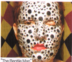
"The Reptile Man"

למאורה הקרקס הוא הנושא שבו עוסקת האמנית בתערוכתה זו, אך למעשה זוהי טקטיקה לדיון נרחב בנקודת מבט וביחסי הכוחות בין צופה ונצפה, בין אמן לקהל. "Charivari" נקראת התערוכה, שאצרה יעל קיני, כך מכונה בודרגון הקרקס כניסתם הרועשת של האקורדיונים והליצנים לזירה, אך נדמה כי אלו אנשים דומים ושותפים. הר"עש שהם עושים הוא חלק נוסף מן התחפושת, מהעמדת הפנים השמחה. בתערוכה נושרת העמדת הפנים, ונותר עימות של הצופה עם מבט שמוחזר אליו